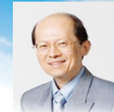
新加坡陈英俊医生 供稿